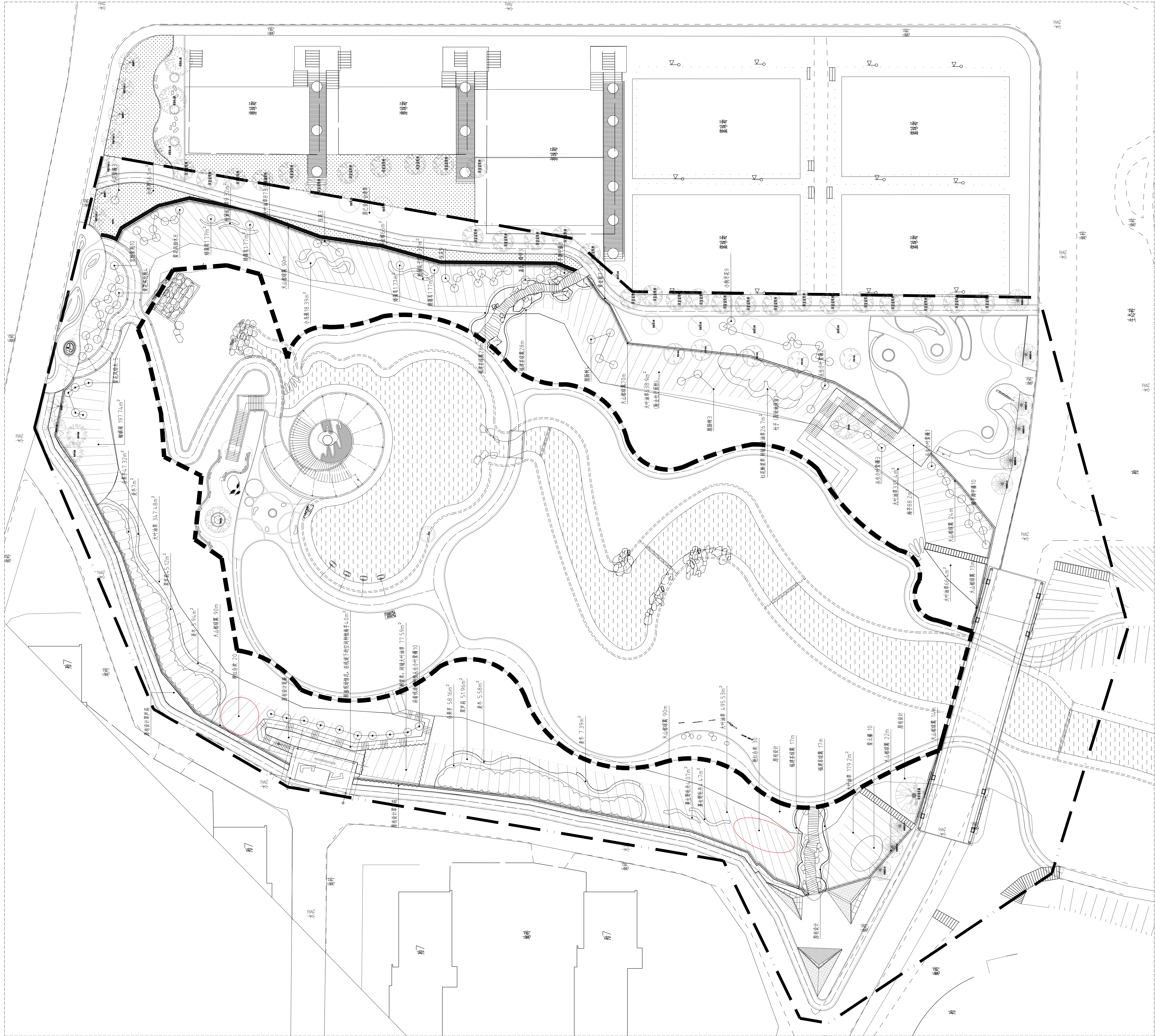
1 创园植被种植平面图 SCALE 1:200